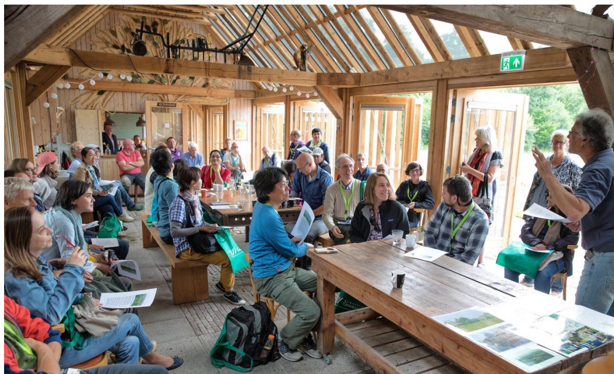
Curringherveld even als 'Centrum van de wereld' – Internationaal Congres 'Practising the Commons' – 13 juli 2017