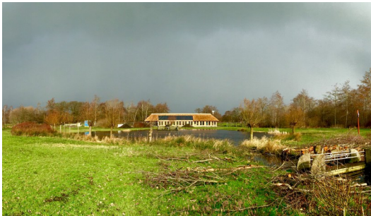
24 februari 2016 – Ekohome, Ekodrome..