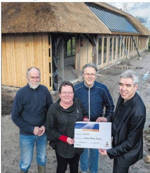
24 februari 2016 – Cheque van 15.000 € van het Leefbaarheidsfonds Rabobank!