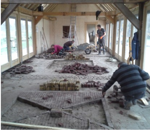
19 december 2015 – Op hun vrije zaterdag zijn vrijwilligers aan de slag met de mozaïek bestrating binnen in het Ekohome. Op de voorgrond de aanleg van een zandloper..