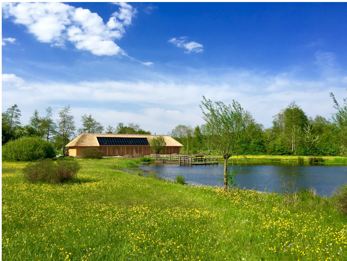
Geen 'artist-impression', maar écht! De Curringerschuur in een Curringerveld in volle bloei – 11 mei 2016