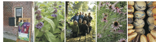
Fieremaheerd <-> Kleine Meeden <-> Curringherveld <-> de Groene Gast <-> De Halszaak