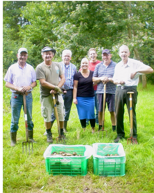
De drie vrijwilligers van de Voedselbank in het midden geflankeerd door 4 vrijwilligers van C&Hek: soms komt alles samen.

Kornhorn, 20 augustus 2013 - Soms komt alles samen, zoals vanmorgen in het Curringherveld... De kinderen van onze Groene School, die op 23 april aardappelen hadden gepoot, kwamen terug om ze met hulp van de vrijwilligers van C&Hek te rooien om zelf te zien dat er 5 tot 7 aardappelen uit één poter groeien. Ze konden allen een bakje mee naar huis nemen voor 'de proef op de som' maar ze hebben vooral flink geholpen om de oogst in kratten te verzamelen voor de Voedselbank van Grootegast en Marum!