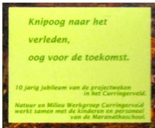
Elfje bij 'Het OOG'