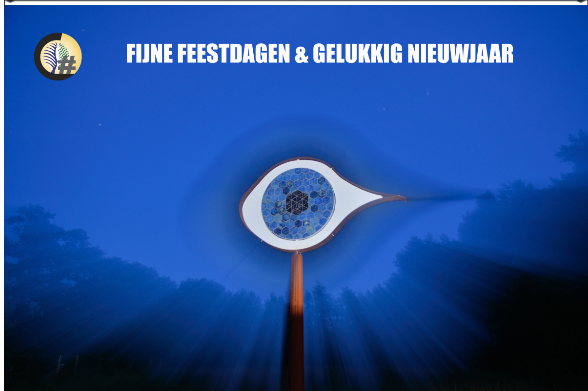
Het OOG ('Eye in the sky') - Kunstobject 2013 - NME-werkgroep Curringherveld Kornhorn - Foto: Ferenc Szilágyi