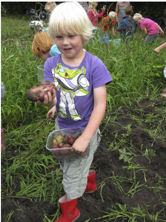
De grote rode biologische Raja oogst bewondering..

De kunstroute werd feestelijk geopend op 17 juni 2013 als kroon op de projectweken die van 20 tot 30 mei werden gehouden.