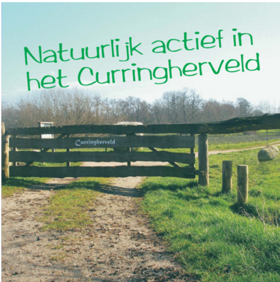
Frontpagina folder C&HEK (maart 2007)